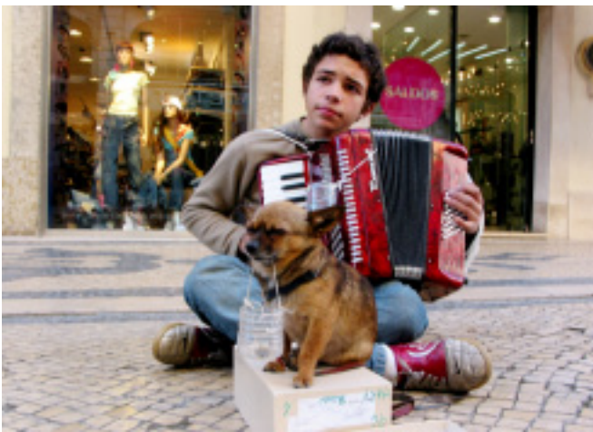
Figura 27. Un perro colabora a su dueño a trabajar mientras toca música.

Vale la pena recordar que el ruido puede ser un indicador de que el perro está saturado y cansado del ambiente, entonces es hora de dar un paseo con él.