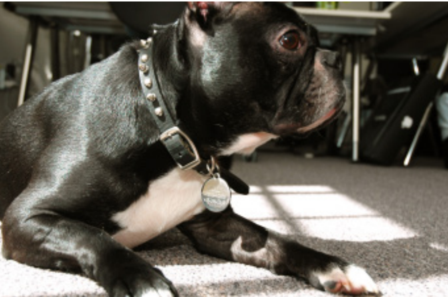
Figura 20. Los perros son sensibles a los espacios, es necesario escucharlos a ellos.

El lugar ideal donde se podría implantar el programa sería en una oficina, ojalá de tamaño mediano (10 empleados en total), y ojalá con espacios individuales, es decir, oficinas personales o de pequeños grupos de personas. Esto porque, de ser necesario, lo único que se tendría que hacer para aislar el perro de los humanos es cerrar la puerta de la oficina. El lugar debe contar con una muy buena ventilación e iluminación adecuada. También sería importante que contara con un patio (interno, trasero o delantero), donde los perros tengan libertad de correr, de tomar aire fresco y relajarse. Sabemos que estas condiciones no son el común denominador de las empresas de Bogotá. Nos atrevemos a afirmar que la situación espacial de muchas empresas es la de los cubículos compartidos, donde se acomoda el espacio de trabajo de entre 6 – 10 personas, son espacios con poca ventilación o ventilación artificial (ventiladores o respiraderos).