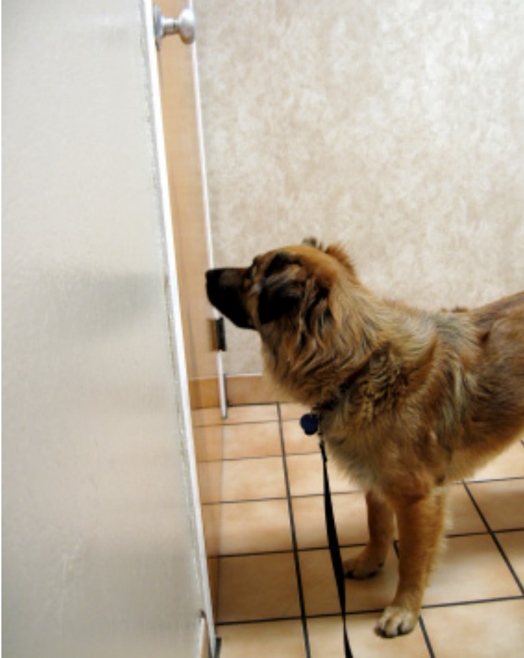
Figura 22. Los riesgos no se deben ver como barreras, porque siempre puede haber soluciones.