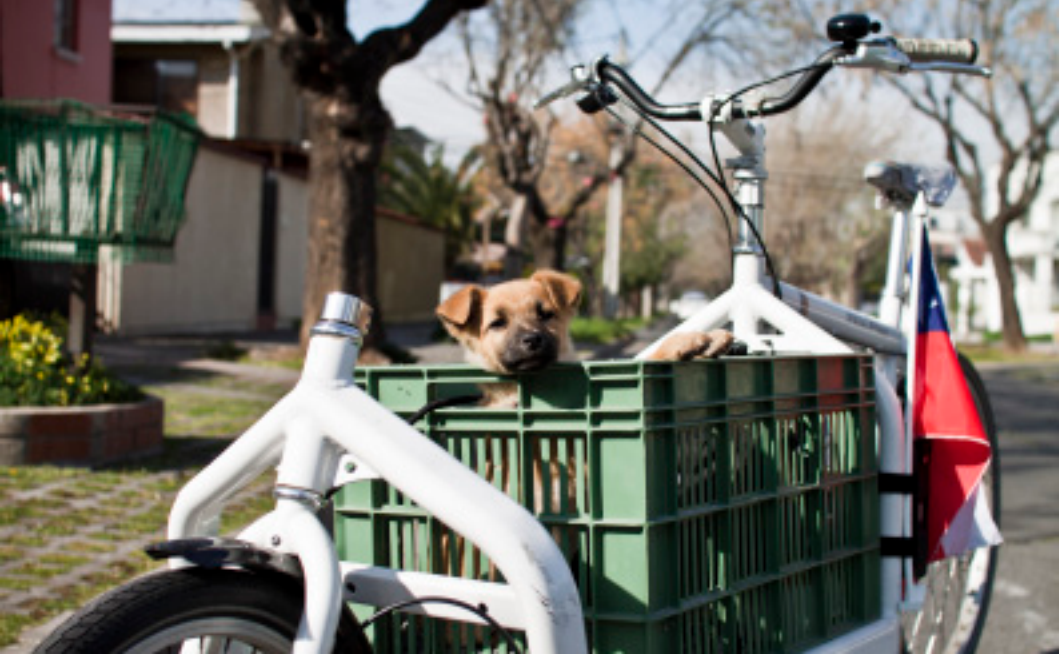
Figura 3. Cuando se hacen las cosas a un tiempo justo, se encuentran nuevas posibilidades.

consigo la “innovadora idea” de la comida rápida. Esta idea ha provocado cambios en la forma en que la gente se alimenta. La ha hecho proclive a cambiar su ritmo, y al mismo tiempo ha modificado la misma experiencia de alimentarse como nunca antes en la historia, afectando los productos mismos de consumo (comida), la actividad de comer, las relaciones que se gestan alrededor de ésta, generando repercusiones en todos los ámbitos de la vida humana: salud, simbólica, política, económica, medio ambiental. La resistencia que se generó en Italia no ha sido poco relevante. Trascendió tanto que hoy se habla de una filosofía Slow en la que el principio vector es hacer las cosas en un tiempo justo.