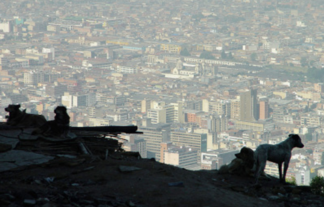
Figura 5. La condición de vida de los perros en la ciudad de Bogotá es complicada, ya que hay una fuerte estigmatización y rechazo hacia ellos.