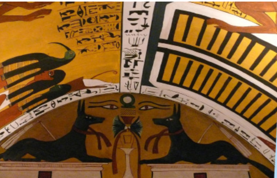
Figura 2. Animales de compañía en el imperio Egipcio además de su utilidad, eran un indicador de prestigio. Existen teorías que dicen que hay 400 razas de perros cuyo origen se puede trazar a este lugar.

Los animales han estado acompañando al humano en diferentes momentos de la historia. Sea cual fuere la sociedad, los animales de compañía son una constante. Se encargaban de estar con sus amos, eran una suerte de segunda sombra con la que se podía interactuar físicamente y podían ayudarle al humano en la realización de diferentes tareas como la caza, la pesca, la carga, o simplemente la compañía afectiva. Eran, además, un indicador de prestigio en algunos escenarios.