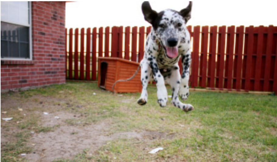
Figura 21. ¡No se dejen llevar por el impulso! Las recomendaciones son importantes para tener éxito en la programa.

En esta ley es claro que no se puede incurrir en ningún tipo de maltrato animal a la hora de llevar a cabo el programa, en primera medida porque busca traer beneficios para los actores de la misma, y no para incurrir en afectaciones a alguno. De ser así, se estaría yendo en contravía del programa y en contravía de la ley como tal.