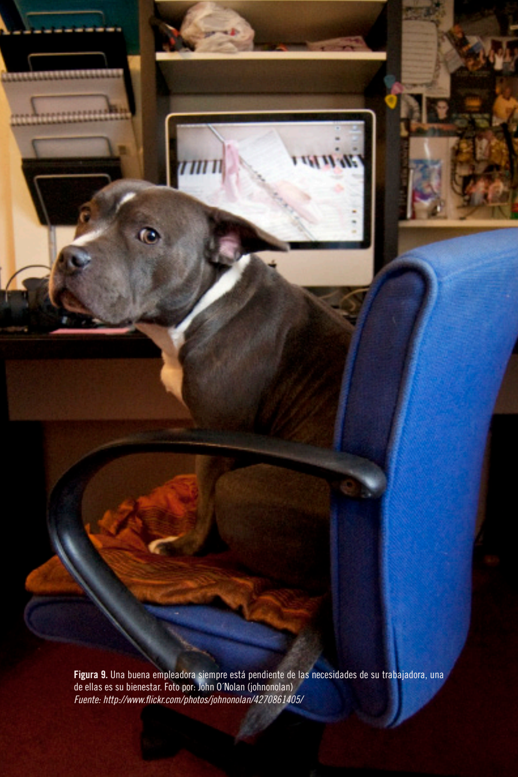
Figura 9. Una buena empleadora siempre está pendiente de las necesidades de su trabajadora, una de ellas es su bienestar.