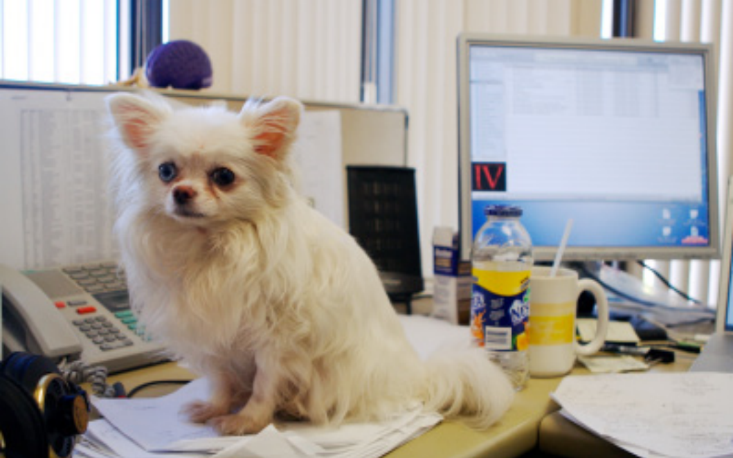
Figura 19. Se deben escoger muy bien las mascotas que se quiera llevar al trabajo para evitar problemas.