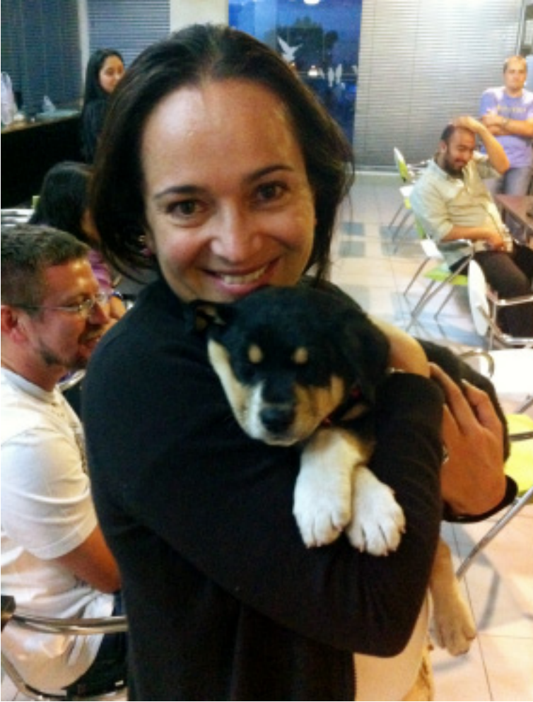
Figura 12. Cuando Joe era cachorro la oficina de Studicom fue su segunda casa.

perjudicial de otro modo y volverla benéfica. Normalmente las personas que tienen contacto con este tipo de actividades son enfermos crónicos, adultos mayores, infantes, enfermos mentales y reos en cárceles. Si las Actividades Asistidas con Animales sirven para este tipo de poblaciones, ¿por qué no expandirlas a otros ámbitos?