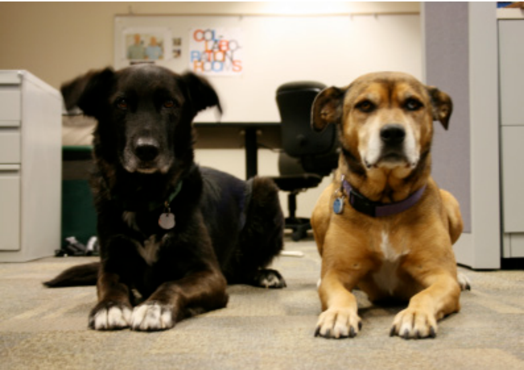
Figura 1. Los perros educados son bienvenidos en las oficinas. Watson y Cressi lo demuestran posando en esta foto.

Hemos decidido escribir un libro acerca de cómo llevar las mascotas al lugar de trabajo, lo cual tiene una relación directa con Despacio y con la filosofía Slow. Nuestra primera tarea es explicar por qué existe esta relación.