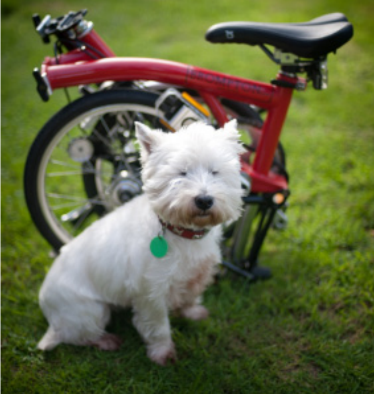
Figura 4. Así como es importante pensar en formas no motorizadas de transporte para mejorar la calidad de vida en la ciudad, entablar una relación más amigable con los animales en las ciudades hace parte de nuestras motivaciones en Despacio.