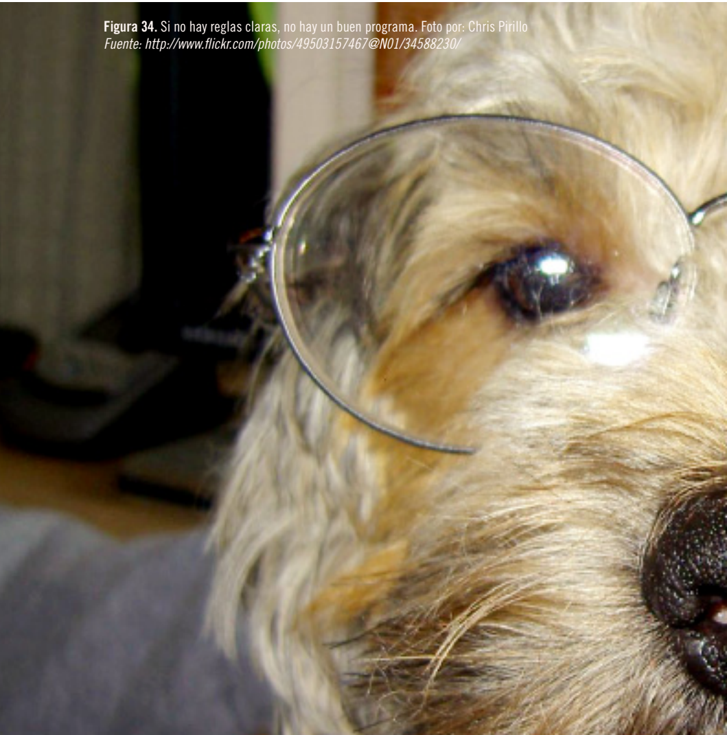
Figura 34. Si no hay reglas claras, no hay un buen programa.