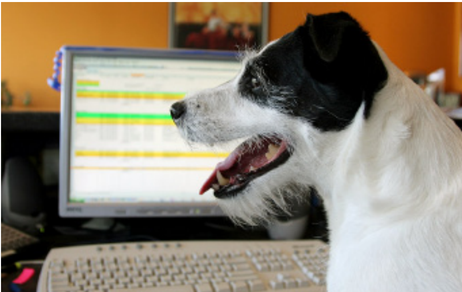
Figura 8. Se ha demostrado que permitir a las mascotas en el trabajo tiene un impacto positivo en la productividad de la empresa.

Una reciente polémica ha sido generada en torno a las dinámicas que se forjan alrededor de la actividad del trabajo en la sociedad colombiana. Una consulta consistió en realizar encuestas por la empresa trabajando.com, donde se encontró que el 64% de los colombianos es adicto al trabajo, lo que redundaría en una separación considerable de los otros ámbitos de la vida social, como las relaciones afectivas, la familia, los momentos de dispersión o diversión, así como los momentos de actividades de hobbies o realización personal. Si el 44% de los encuestados asume un costo familiar (no ver a sus hijos) ¿qué se esperaría del costo de contacto con sus mascotas, que también son integrantes de la familia, y que siempre serán dependientes de sus amos?