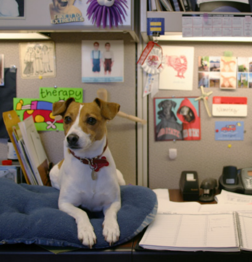
Figura 7. Muchas personas sueñan llevar su mascota al trabajo.

¿Cómo se pueden beneficiar las personas y las mascotas que se involucran en un programa de “Mascotas al Trabajo”? Hay tres actores que serán descritos a continuación (la empresa, la empleadora, la empleada) que obtienen beneficios.