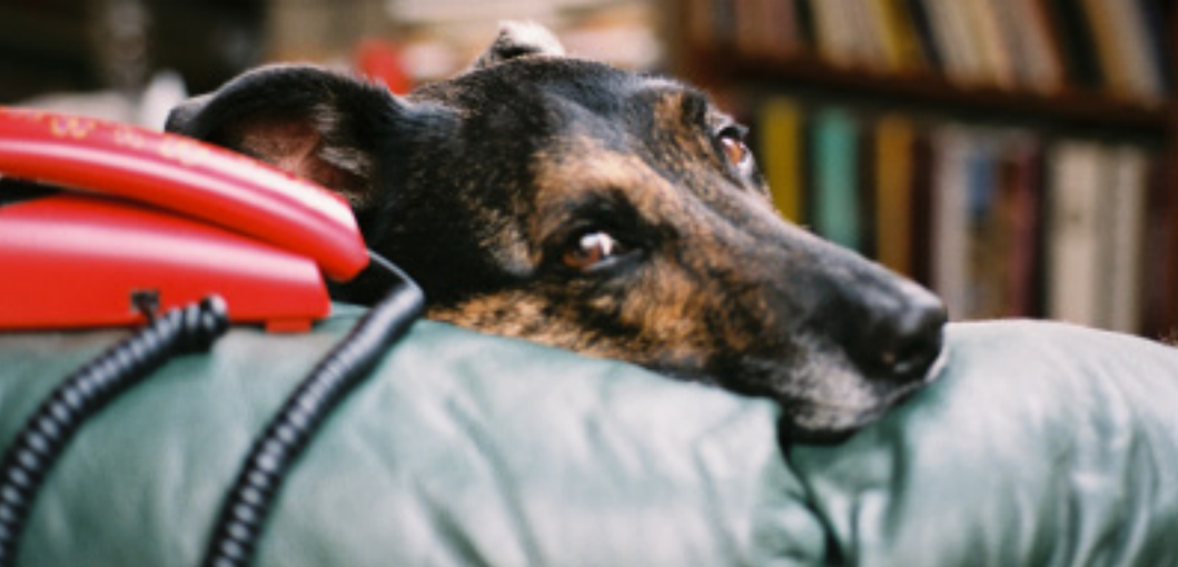
Figura 14. Los animales son seres que sienten emociones.

La mascota podrá estar en mayor contacto con su amo, con otras personas y animales, lo que favorecerá en su sociabilidad e incrementará eventualmente su calidad de vida y estado psíquico. Sin embargo, para potencializar los beneficios sobre los riesgos o efectos perjudiciales son necesarias algunas condiciones en las oficinas para darle cabida a un animal.