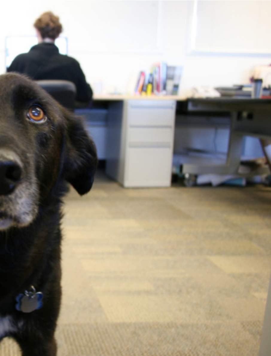
Figura 28. Poder sobrellevar los retos de la aplicación de la programación, significará un gran avance que beneficiará a todos los integrantes de la oficina.