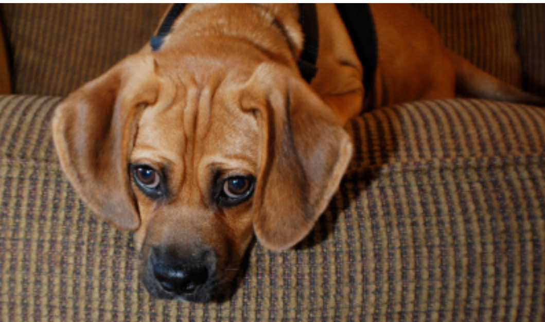
Figura 24. Los perros tienden a aburrirse cuando están solos.

Es por ello que es necesario que se les permita hacer ejercicio varias veces al día, durante las pausas activas, por ejemplo, en las que los trabajadores tienen derecho a salir de su rutina laboral por 10 minutos cada hora. Podrían darles un paseo a los perros de 20 minutos cada dos horas, y así se evita que se sientan aburridos, descargan toda la energía que han acumulado y el trabajador está haciendo ejercicio, cambiando de ambiente y haciendo un uso productivo de la reglamentación de las pausas activas.