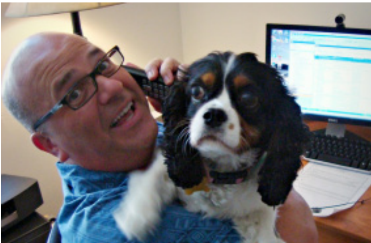
Figura 10. El propietario de este perro tituló la foto "Perros en el trabajo".

Los beneficios que el empleador disfrutará al implementar el programa son: materialización de las pausas activas en actividades mucho mejor invertidas para la salud de sus trabajadores, garantía de la prevención de enfermedades mentales ocasionadas por la presión psicolaboral, garantía de un espacio agradable y cómodo para que sus trabajadores rindan mejor y con gusto.