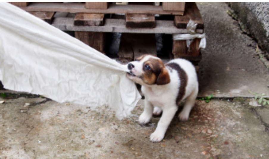
Figura 16. Los perros también pueden ser traviosos.