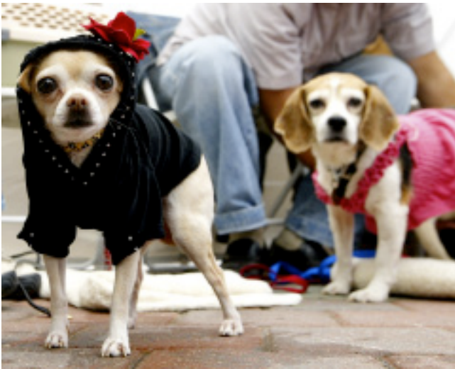
Figura 13. Un trabajador le da el mismo valor a sus compañeros y a su mascota.

Por otro lado, la persona que no tiene animales también puede verse beneficiada en la medida en que genera, aunque sea por el tiempo en que está en la oficina, un contacto con la naturaleza que resulta ser muy positivo