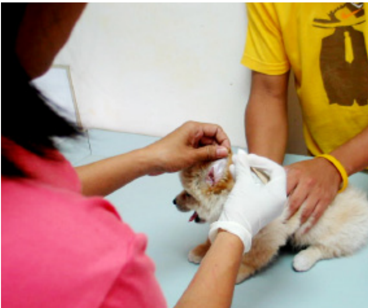
Figura 30. Tener las vacunas al día, un régimen de limpieza y un protocolo de comportamiento son condiciones mínimas para aceptar a una mascota en la oficina.