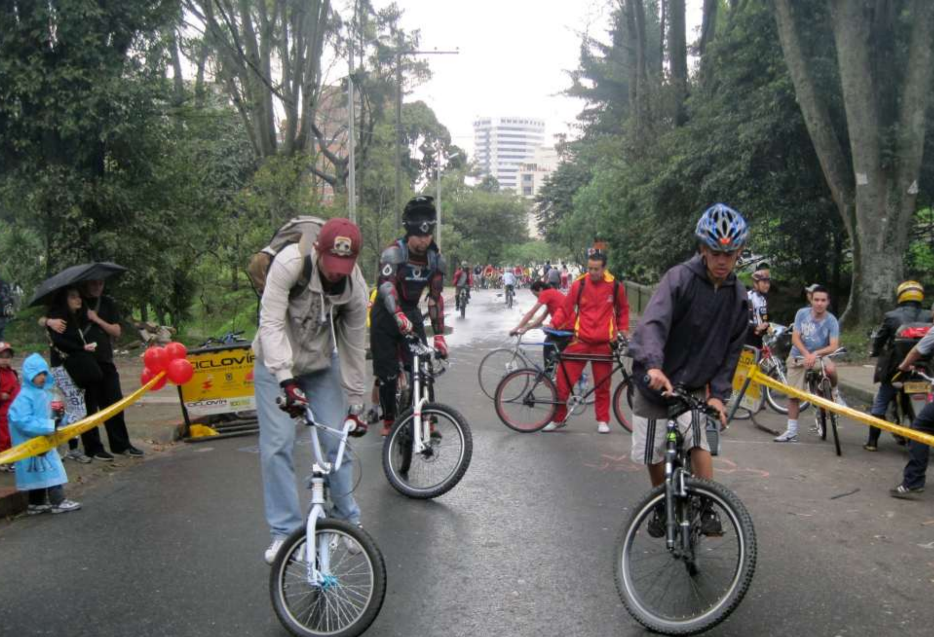
Slow bicycle race